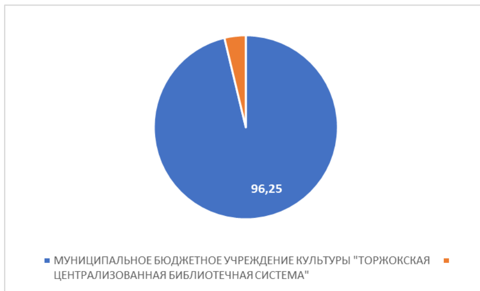
Рисунок 2 – Интегральный показатель по критерию «Комфортность условий предоставления услуг»

По второму критерию «Комфортность условий предоставления услуг» МУНИЦИПАЛЬНОЕ БЮДЖЕТНОЕ УЧРЕЖДЕНИЕ КУЛЬТУРЫ "ТОРЖОКСКАЯ ЦЕНТРАЛИЗОВАННАЯ БИБЛИОТЕЧНАЯ СИСТЕМА" набрало 96,25 балла (Рис.2).